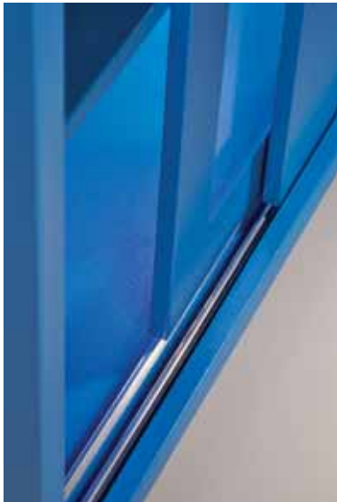
Yüksek kaliteli sürgü mekanizması. High quality slide mechanism.