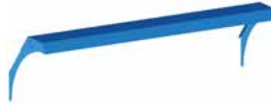
Sürgü Kapılı Üst Dolaplar İçin Aydınlatma Modülleri Lighting Modules for Sliding-Door Workbench Upper Cabinets