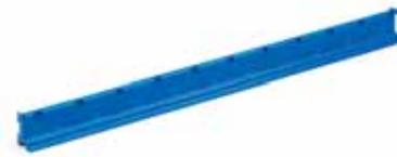
Avadanlık Asma Bantı Bin Storage Strip