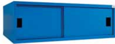
Sürgü Kapılı Üst Dolaplar Sliding-Door Workbench Upper Cabinets