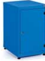
Kapaklı Dolaplar Hinged Door Cabinets