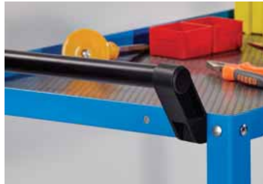
Ergonomik itme kulpları / Ergonomic handles